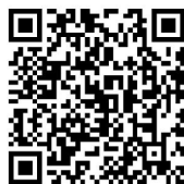
扫码进入访客预约